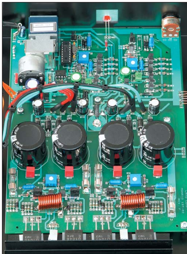
Ingrandimento della sezione elettronica totale: in alto i circuiti pre linea con i potenziometri di volume (a sinistra, un Alps motorizzato di alto pregio) e assai più piccolo (a destra) quello del bilanciamento; diodi raddrizzatori e 4 capacità di livellamento al centro; 2+2 dispositivi finali di potenza su alette a contatto con lo spesso chassis in basso, in primo piano.